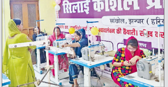
बहादुरगढ़। सांखोल में शुरु किए केंद्र में सिलाई सीखती महिलाएं।