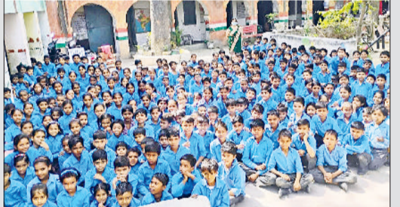
बहादुरगढ़। परनाला स्कूल में हुए कार्यक्रम में उपस्थित विद्यार्थी।