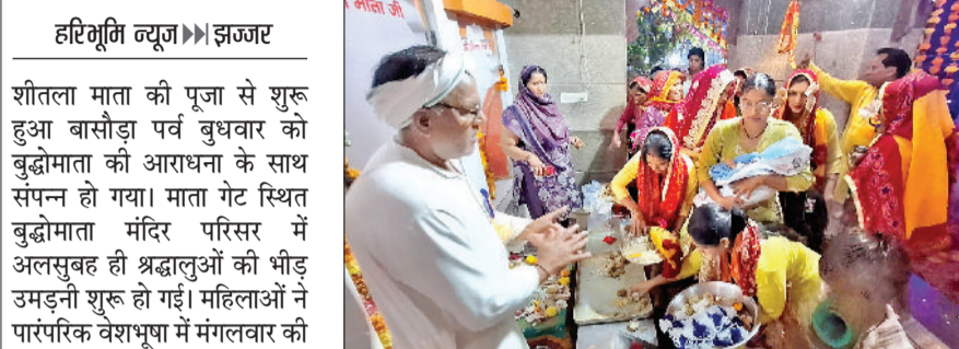
झज्जर। बुद्धो माता की पूजा अर्चना करते हुए महिलाएं।