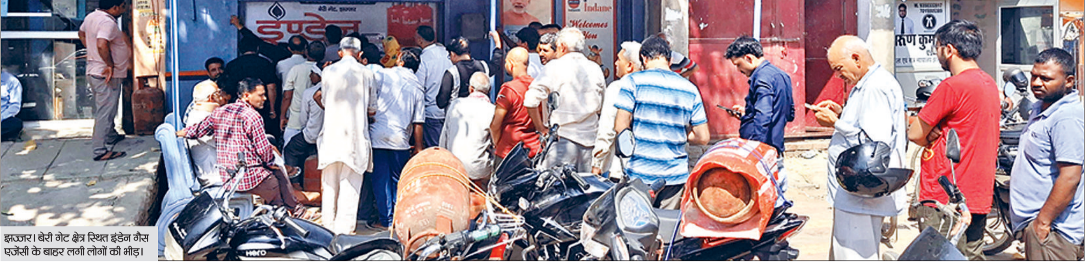
इज्जर। बेरी गेट क्षेत्र स्थित इंडेन गैस एजेंसी के बाहर लगी लोगों की भीड़।