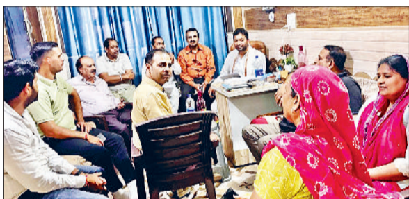
बहादुरगढ़। बैठक में प्रशिक्षण कार्यक्रम को लेकर चर्चा करते भाजपाई।