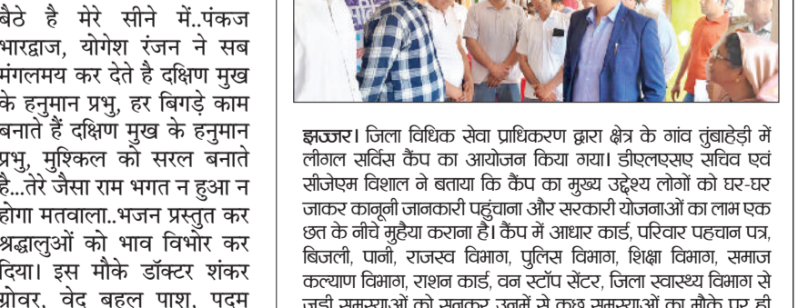
झज्जर। जिला विधिक सेवा प्राधिकरण द्वारा क्षेत्र के गांव तुंबाहेड़ी में लीगल सर्विस कैंप का आयोजन किया गया।