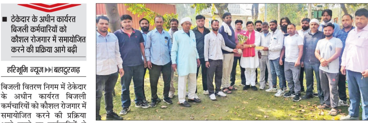
बहादुरगढ़। दिनेश कौशिक का आभार जताते प्रभावित बिजलीकर्म।

टेकेदार के अधीन कार्यरत बिजली कर्मचारियों को कौशल रोजगार में समायोजित करने की प्रक्रिया आगे बढ़ी बिजली वितरण निगम में टेकेदार के अधीन कार्यरत बिजली कर्मचारियों को कौशल रोजगार में समायोजित करने की प्रक्रिया आगे बढ़ने पर कर्मचारियों ने बुधवार को भाजपा नेता दिनेश कौशिक से मुलाकात कर उनका आभार जताया। बता दें कि 8 फरवरी को टेंडर समाप्त होने के कारण बहादुरगढ़ बिजली वितरण निगम में अप्रैल 2016 से टेकेदारी प्रथा के तहत कार्यरत करीब 106 कर्मचारियों के सामने रोजगार का संकट खड़ा हो गया था। टेंडर समाप्त होने के बाद कर्मचारियों में नौकरी को