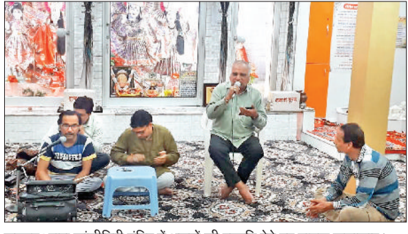
झज्जर। बाबा काशीगिरी मंदिर में भजनों की प्रस्तुति देते हुए गायक कलाकार।