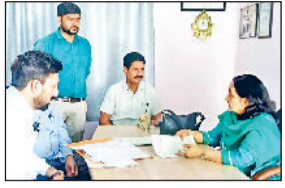
बहादुरगढ़। नशा मुक्ति केंद्र में निरीक्षण करती सीएमओ व अन्य।