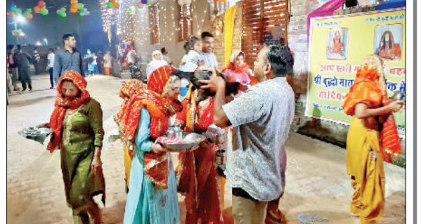
झज्जर। मेले में मुर्गा छुड़वाने की परंपरा का निर्वहन करते हुए श्रद्धालु।

आयोजक समिति द्वारा किए गए पुख्ता प्रबंधों के चलते श्रद्धालुओं ने कारगर तरीके से माता के दर्शन किए। समिति द्वारा की गई बैरिकेड्स की व्यवस्था के चलते श्रद्धालुओं को दर्शन के लिए अधिक परेशानी का सामना नहीं करना पड़ा। श्रद्धालुओं की भीड़ को ध्यान में रखते हुए व्यवस्था बनाए रखने के लिए वालंटियर्स को भी जिम्मेवारी सौंपी गई थी जिन्होंने अपने कार्य को बखूबी निभाया। अन्य पूजा स्थलों पर भी प्रसाद चढ़ाया। बुद्धोमाता मंदिर परिसर में इस अवसर पर विशाल मेला का आयोजन किया गया। आयोजित