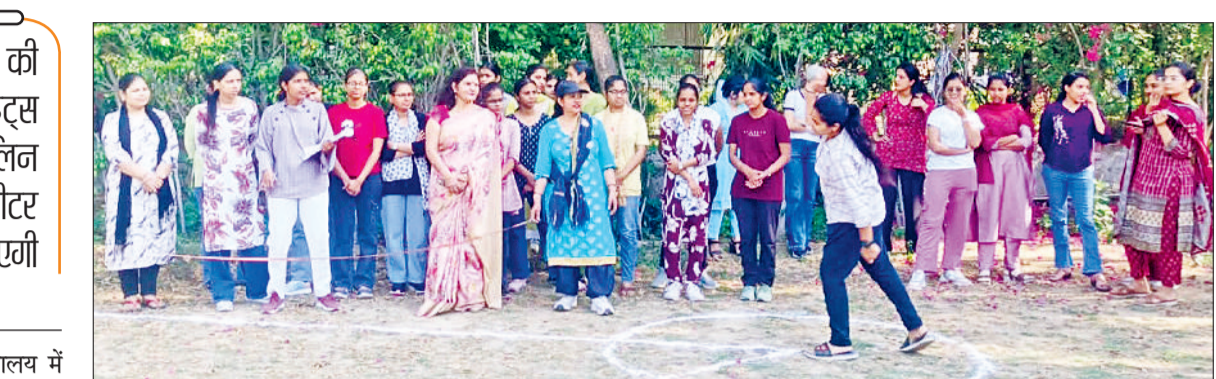
बहादुरगढ़। प्रतियोगिता के पहले दिन शॉटपुट फेंकती छात्रा।

विद्यार्थियों को खेल भावना के साथ भाग लेने के लिए किया प्रेरित