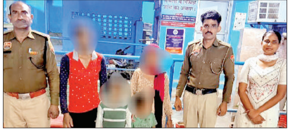
झज्जर। बरामद हुए बच्चे अपने अभिभावकों व पुलिस टीम के साथ।

हरिभूमि न्यूज़ झज्जर पुलिस की एक टीम द्वारा अपने माता-पिता से बिछड़े दो मासूम बच्चों को सकुशल बरामद कर उनके परिजनों के हवाले किया है। प्रवक्ता ने बताया कि पुलिस को सूचना प्राप्त हुई कि दो बच्चे अपने माता-पिता से बिछड़कर लापता हो गए हैं। बच्चों के माता-पिता मूल रूप से उत्तर प्रदेश के रहने